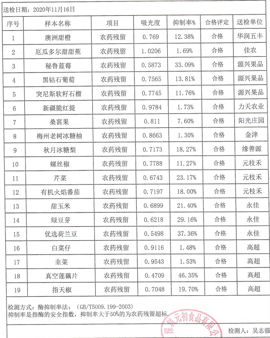
深圳元初水果蔬菜农药残留测量数据表